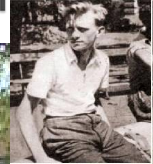
Patron Szkoły Podstawowej i Gimnazjum Janek Bytnar „Rudy”